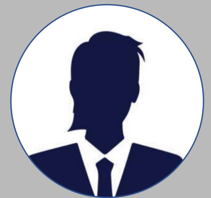
Em Aberto Conselheiro de Veículos Antigos